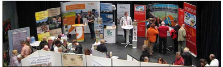
Auch im vergangenen Jahr ging das Peiner Land auf der REGIO 100 an den Start

Darauf folgen der Wendeburger Spargelmarkt am 29. Mai, der Lengeder Herbstmarkt am 3./4. September und der Entdeckertag Hannover am 4. September in Zusammenarbeit mit Peine Marketing.